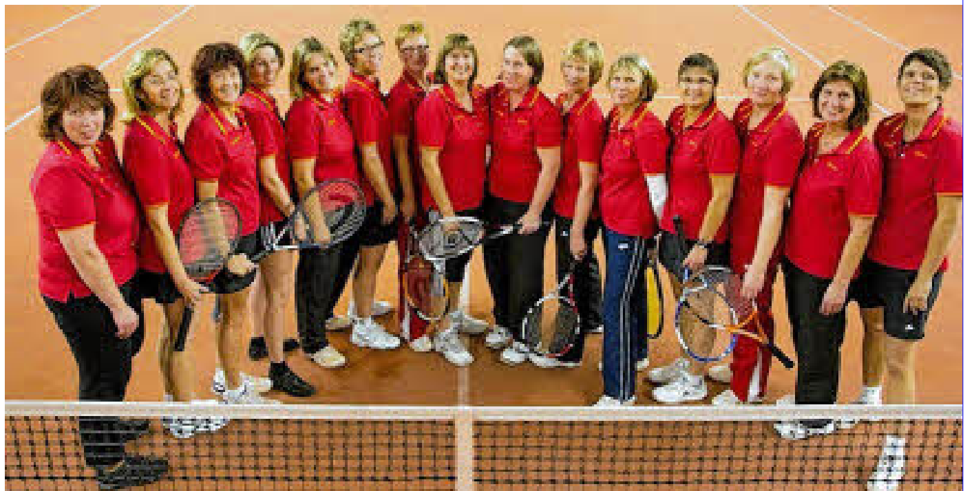
Die Damen 30 der Tennisabteilung freuen sich über ihren ersten Platz in der Bezirkspokalrunde.