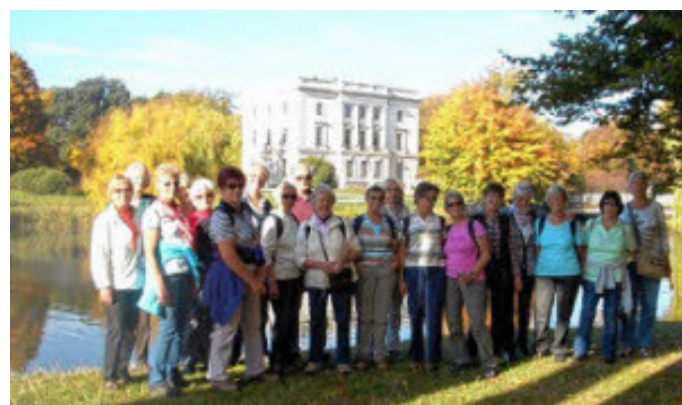
Vergangenes Jahr ging es auch zum Weißen Haus in Markkleeberg.

ma Museum > geführte Wanderungen > Pauschal-Reiseversicherung