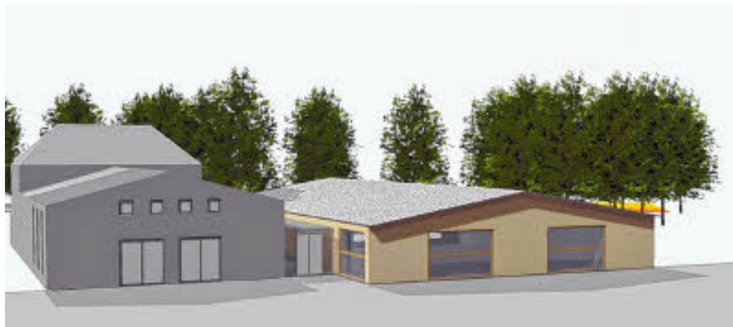
Der neue Mehrzweckraum (rechts) wird an den Kursraum 1 angedockt.

Der Anbau schließt direkt an den jetzigen Kursraum 1